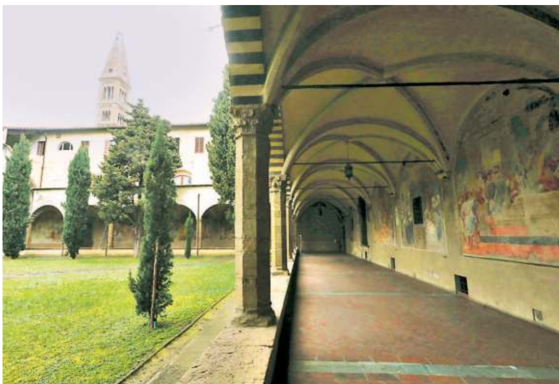
▲ Il chiostro Uno degli spazi esterni del grande complesso di Santa Maria Novella