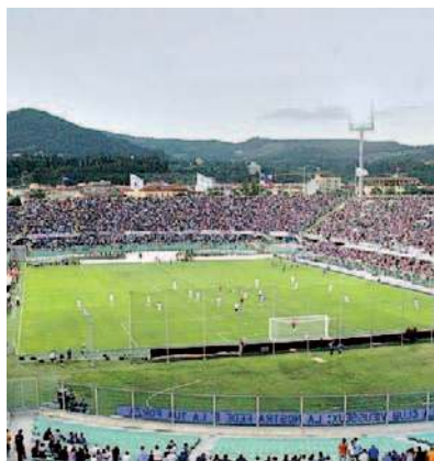
▲ L'impianto Lo stadio Franchi